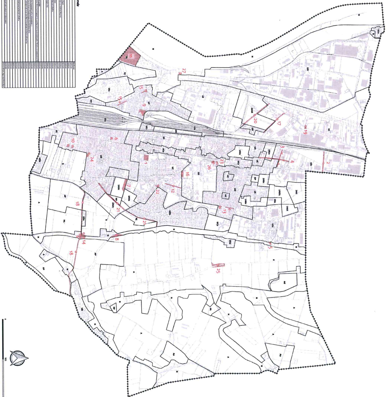
Liste des emplacements réservés